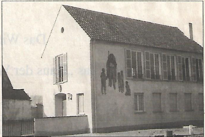
Text: Theodor Frosch Redaktion: Iris Rechner