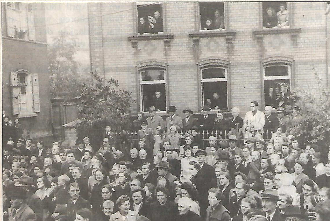
Die Bevölkerung beobachtet interessiert die Grundsteinlegung von der gegenüberliegenden Straßenseite aus (Pfarrhaus, Wohnhaus Becht)